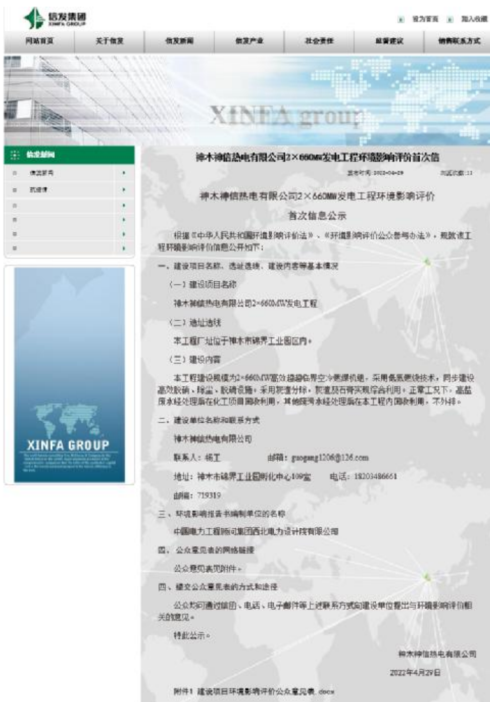
图 2-1 建设单位在其网站发布本项目环境影响评价首次信息公示