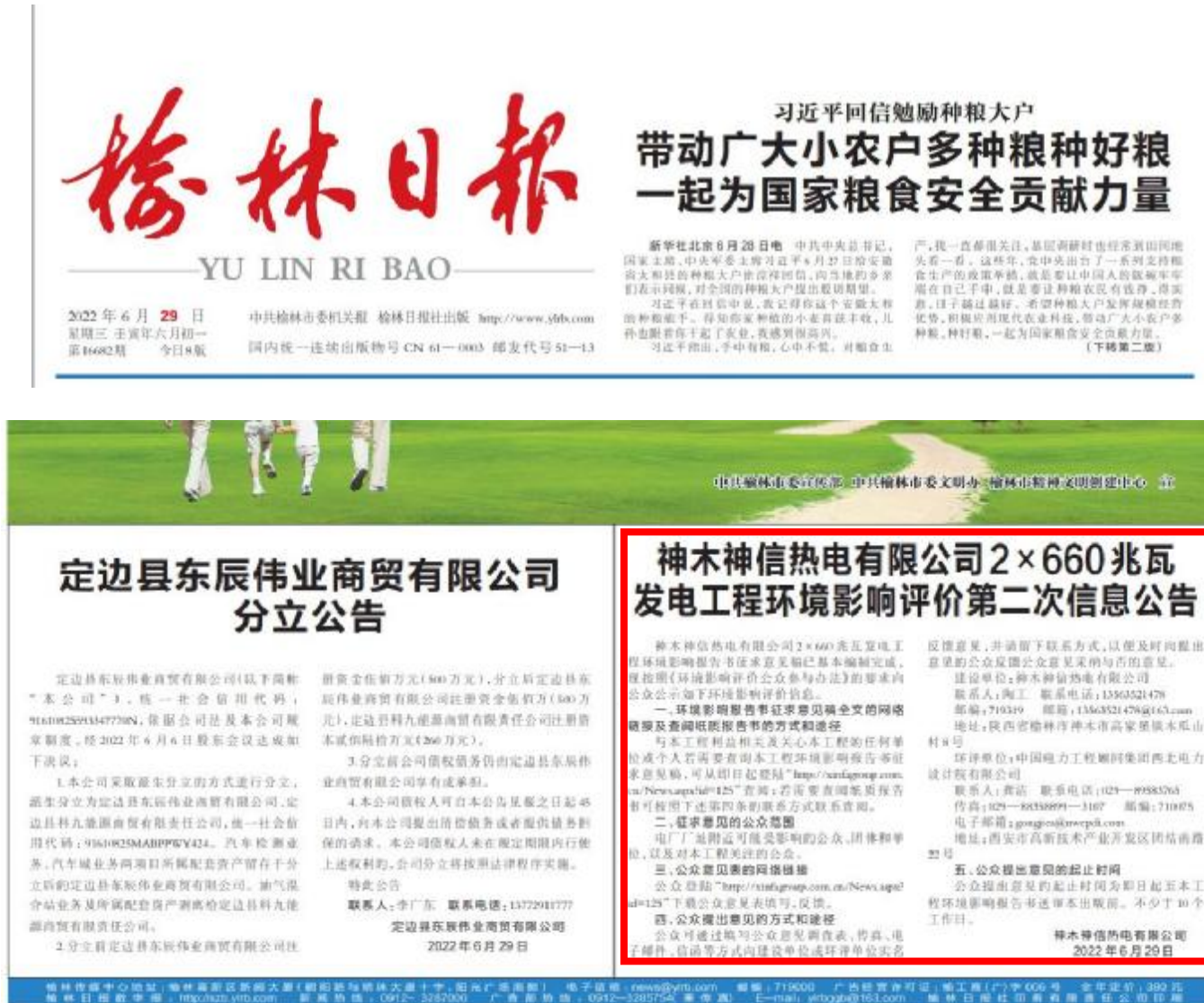
图 3-4 在榆林日报首次发布本项目第二次环境影响评价信息